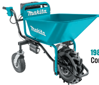
198494-2 Contenedor de acero