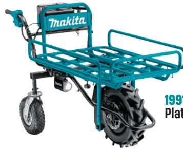
199116-7 Plataforma plana